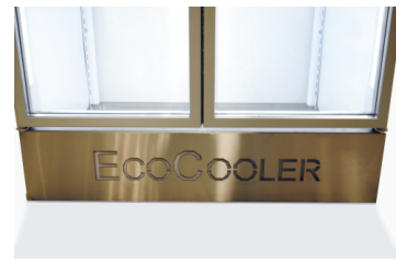
Potkupelti valinnaisella RST-etupaneelilla